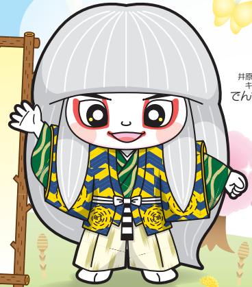
井原市マスコット キャラクター てんちりゅくん